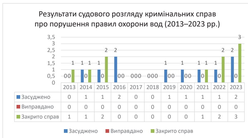
Діаграма 2. Результати судового розгляду кримінальних справ про порушення правил охорони вод (2013–2023 рр.)

Переходячи до аналізу даних відповідного судового розгляду (див. діаграму 2), можна констатувати, що, згідно з даними офіційної статистики, за останні десять років за вчинення аналізованого злочину засуджено всього 10 осіб. Жоден із фігурантів не був виправданий за ст. 242 КК.