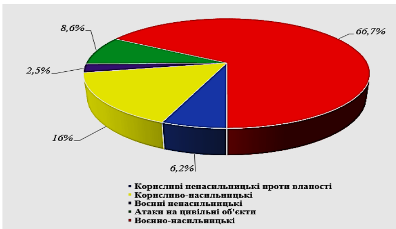
Діаграма 2 Графічне зображення структури вироків за ст. 438 КК України за критерієм виду порушення законів та звичаїв війни (станом на 08.05.2024)

Серед воєнно-насильницьких злочинів проти цивільного населення, за даними судової практики, переважають жорстоке поведіння у виді погроз умисним вбивством, заподіяння тілесних ушкоджень, катування та незаконне позбавлення волі (74 %). Кожен п'ятий (20,4 %) такий злочин, з огляду на дані судової практики, поєднаний з умисним вбивством (ч. 2 ст. 438 КК України). На сексуальне насильство, пов'язане зі збройним конфліктом, припадає 5,6 %. Наголосимо, однак, що це – результати узагальнення вироків. Тобто, йдеться про випадки встановлення особи винного та доведеності його вини. Цілоком зрозуміло, що ці дані не включають як загальну кримінальну статистику, так і латентну частину досліджуваного виду злочинів. Достеменно встановлення останньої не видається за можливе. Утім, очевидним є те, що саме цивільні особи стають основною мішенню вчинення воєнно-насильницьких злочинів в умовах міжнародного збройного конфлікту на території України.